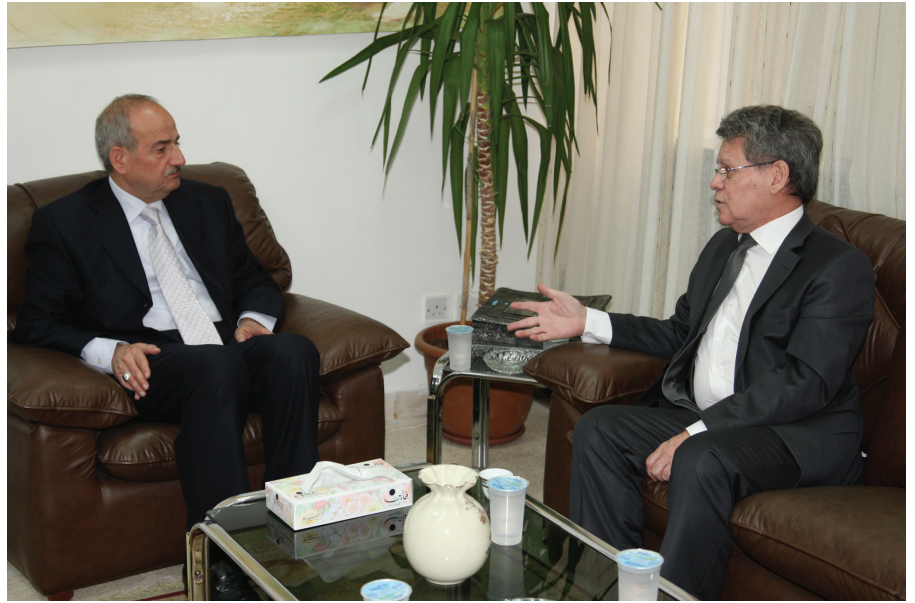
الدكتور الزعبي والسفير الفنزويلي

في الجامعة البوليفارية لخدمة الجاليات العربية في فنزويلا ودول أمريكا اللاتينية. ورحب الدكتور الزعبي بفكرة إبرام مذكرة تفاهم بين الأردن والجامعة البوليفارية تركز على تبادل المدرسين والطلبة وتشجيع إجراء بحوث علمية متخصصة في قطاعات المياه والطاقة والعمل الاجتماعي. وعرض الدكتور الزعبي رؤية الجامعة في تعزيز ثقافة البحث العلمي فيما أكد السفير رغبة جامعات بلاده بتوسيع نطاق التعاون العلمي مع الجامعة.