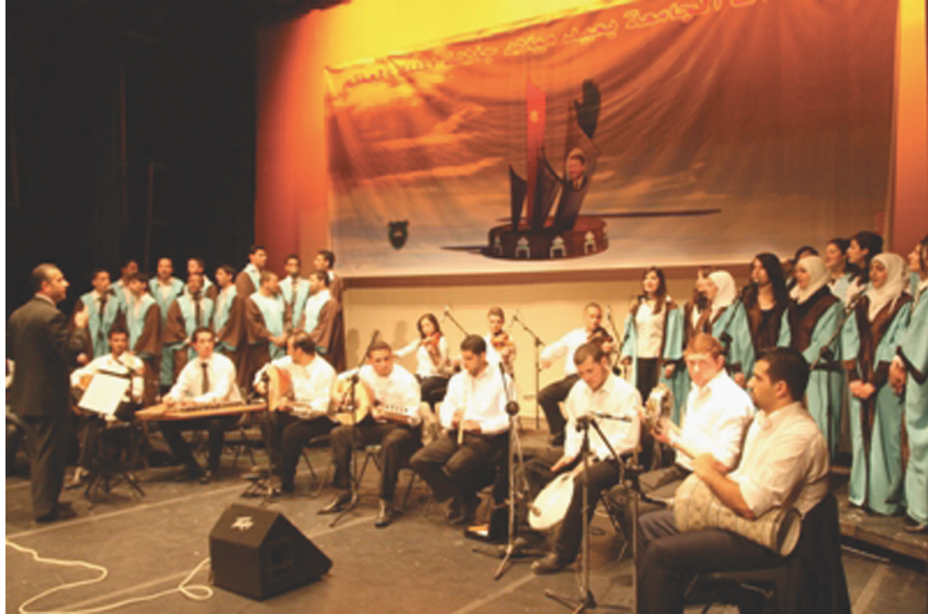
طلبة الجامعة يصدحون حباً ووفاءً لمليكهم