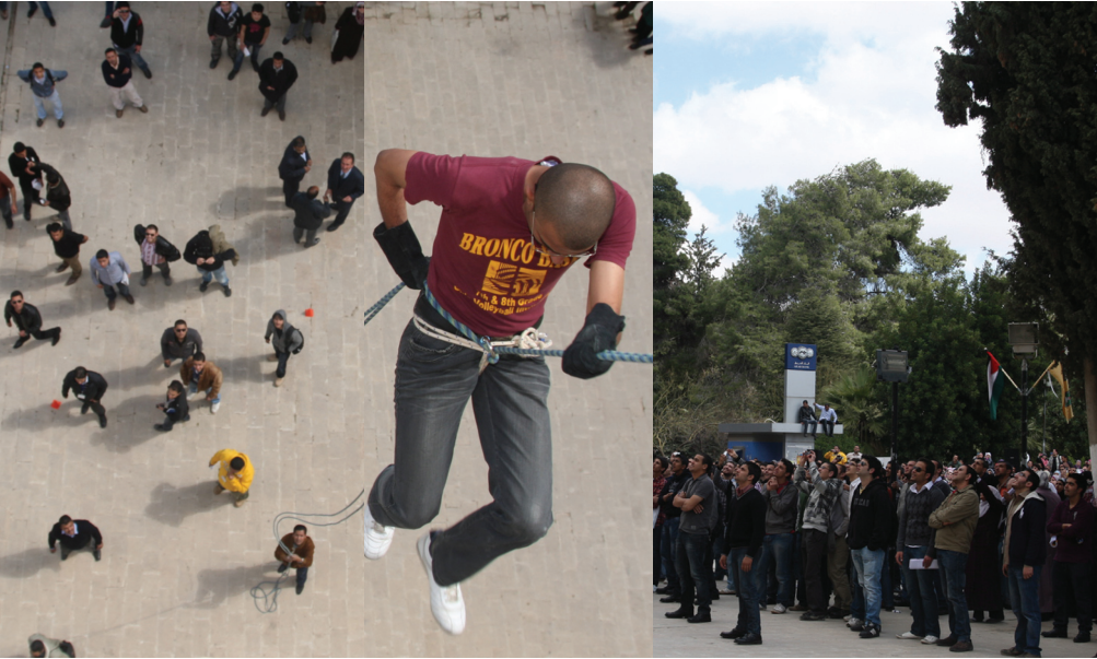
وتتوالى احتفالات الجامعة بهذه المناسبة العالية