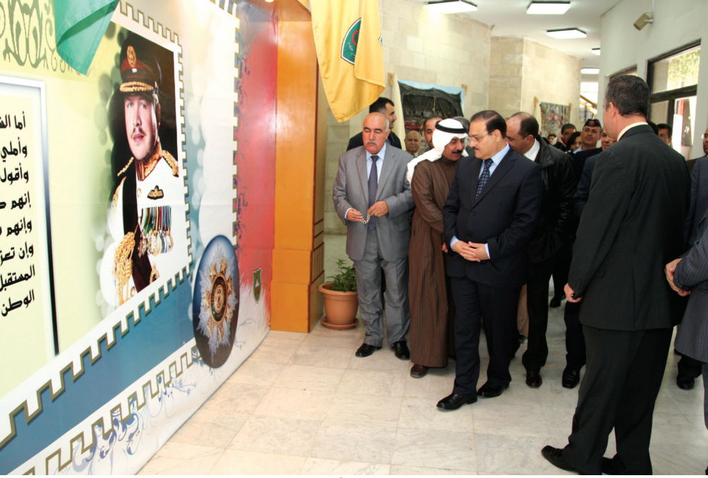
الطويسي والحضور أمام الجدارية

الجامعة - أزاح رئيس الجامعة الدكتور عادل الطويسي الستارة عن لوحة جدارية إيداناً ببدء الاحتفالات بعيد ميلاد قائد الوطن جلالة الملك عبد الله الثاني.