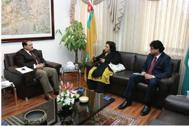
رئيس الجامعة مستقبلاً السفيرة الباكستانية

الطوسي وسفيرة باكستان إمكانية إبرام مذكرات تفاهم بين الجامعة وجامعات باكستانية تتضمن تبادل زيارات أعضاء هيئة التدريس والباحثين والطلبة.