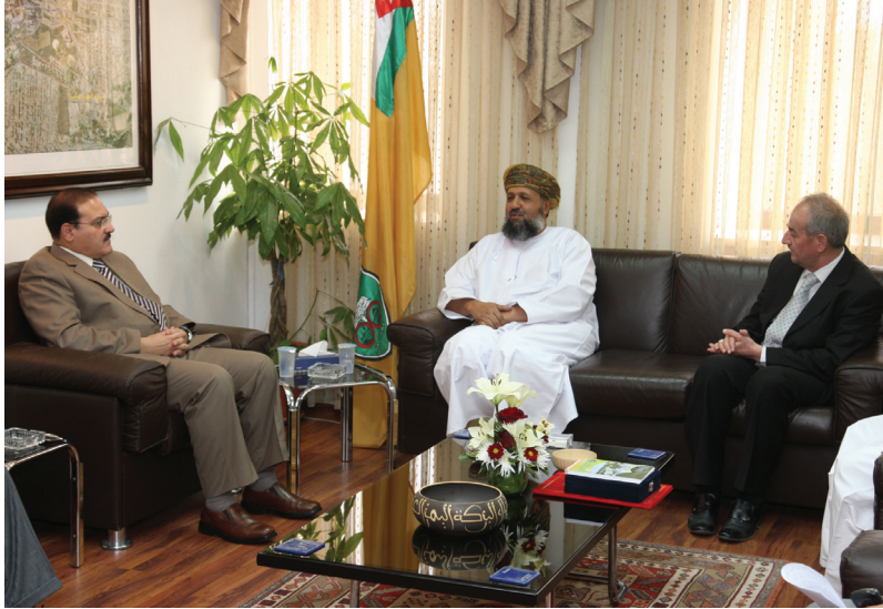
رئيسا الأردنية وصحار العمانية