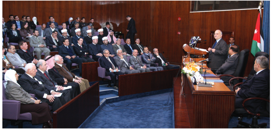
جانب من ندوة الوثام الديني

الجامعة- أكد سمو الأمير الحسن بن طلال أن السلام والوثام مكملا لبعضهما وأنه إذا ساد السلام خلق الوثام الديني بين الأديان الذي يتطلب تأسيسا تربويا وإعلاميا وتثقافيا. وقال سموه لدى رعايته ندوة الوثام الديني بين الأديان في الجامعة إن ما يجمع الديانات السماوية أكثر بكثير مما يفرقها، مشيرا إلى أن مواجهة مشاكل الفقر والبطالة والجوع والجهل والظلم وغيرها في دول العالم تحتاج إلى إرادة جامعة فحوها الوثام.