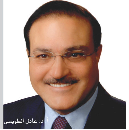
أ. د. عادل الطويسي

انتزع من سنوات خبرته الملتحمة بالثقافة والتعليم العالي والتكنولوجيا كل الصفات ليرسخها بطريقة ذكية وحازمة وشفافة لإدارة الجامعة بكفاءة واقتدار. وهو يعترف في حوار مع «الدستور» لم يخف فيه أي نقاط أنه ما زال يكتشف مواطن وتفاصيل الجامعة الأردنية، حيث حرص رئيس الجامعة الأردنية الدكتور عادل الطويسي ألا يقدم على أي حوار صحفي تفصيلي إلا بعد أن يمك الأمور بشكل صحيح يؤهله للرد على الأسئلة بدقة وصراحة. وفي ما يلي بعض من مقابلة الدستور مع الدكتور الطويسي.