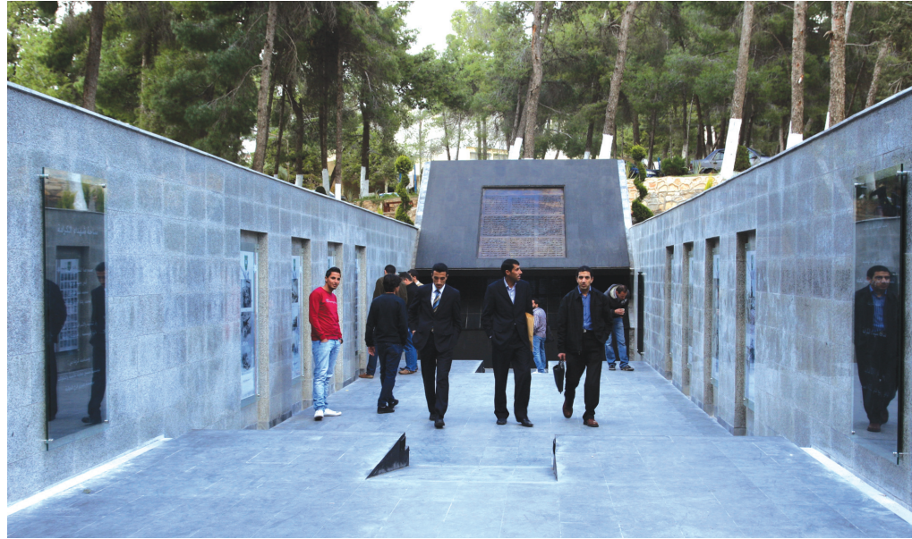
موقع ساحة شهداء الكرامة

وأقامت الدائرة بالتعاون مع مديرية التوجيه المعنوي معرضاً للصور الخاصة بمعركة الكرامة.